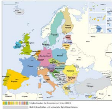
Die Europäische Union